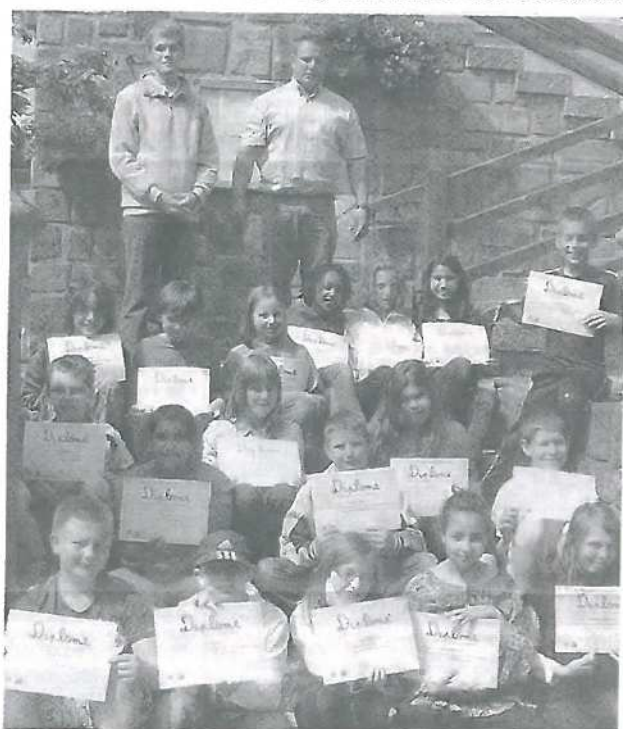
Les élèves de Grandfontaine ont reçu un diplôme pour leur travail.

En effet comme il était question d'ancienne carrière, il fallait savoir de laquelle il s'agissait puisqu'on en trouve deux le long de la route départementale et une à proximité du Pont de Mousse. Or une carte postale montrant à cet endroit un enclos et une croix laissait planer un doute. Il fut résolu en 2013 grâce à un plan rappelant qu'il y eut là une tombe collective de 17 corps. Restait donc à trouver laquelle des deux autres carrières avait servi de lieu d'exécution.