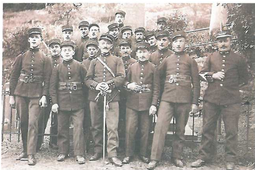
Le corps des sapeurs pompiers devant le monument aux morts vers 1930

C'est la photographie des sapeurs pompiers de Grandfontaine devant un monument aux morts qui est à l'origine de l'historique qui suit. Rien en effet ne laissait supposer qu'il pouvait s'agir du monument de ce village car seuls quelques noms apparaissaient sur la pyramide qui avait, bien entendu, subi des transformations consécutives à l'Annexion et à l'Occupation.