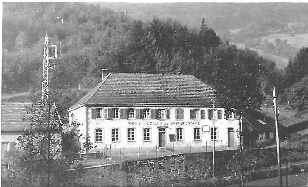
Cette photo montre la façade de l'ancienne mairie&écoles avec la plaque commémorative.